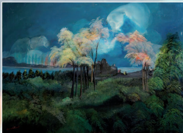
Postavy v krajině