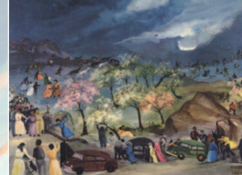
Výlety na venkov

CeSma – Centro Studi Marche Giuseppe Giunchi (Centrum studií oblasti Marche Giuseppe Giunchi) již řadu let organizuje projekty, které mají za cíl představit, prohloubit a valorizovat potenciál oblasti Marche na poli národním a mezinárodním a rozvíjet tyto aktivity v různých oborech kultury, vědy a podnikání.